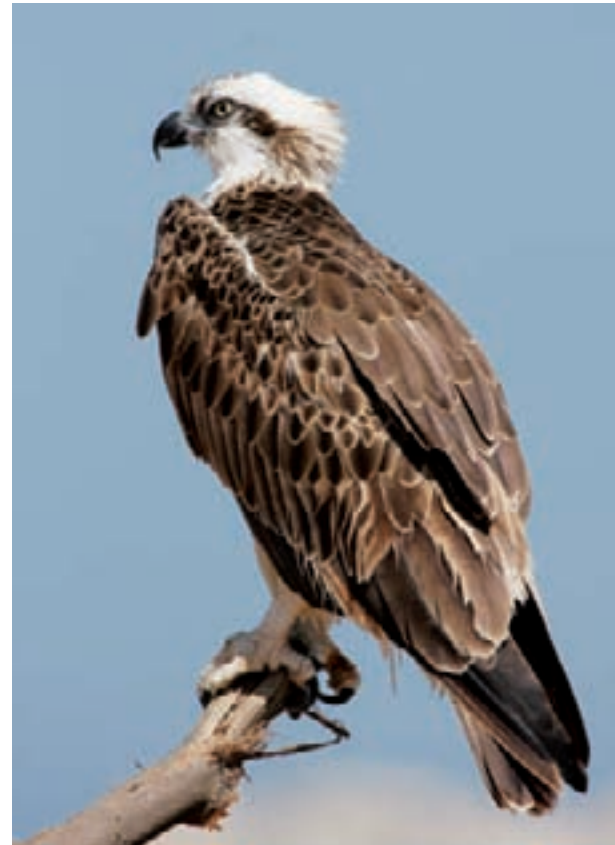
Fischadler brüten auf eigens aufgestellten Pfählen und lassen sich zuverlässig beobachten.

Häufig besucht und sehr empfehlenswert sind der Beobachtungsturm Stangenhagen (6) und die Kiefernkanzel Zauchwitz (7). Von diesen beiden Punkten kann man die wieder vernässte Senke mit Entenweiher, Schwanensee und Gänselaake gut überblicken. Hier liegen besonders bedeutsame Frühjahrs- und Herbst-rastgebiete für Gründelenten, Limikolen und Seeschwalben. Die Beobachtungsbedingungen für Limikolen sind jedoch wegen der hohen Vegetation um die Schlammflächen nicht immer optimal. Den sehr lohnenden Aussichtsturm Stangenhagen (6) erreicht man, indem man 100 m westlich des Ortsausgangs von Stangenhagen direkt hinter dem Pfefferfließ auf der südlichen Seite der B248 parkt und am Westufer des Pfefferfließ zirka 900 m nach Süden geht. Fischadler, Seeadler, viele Schilfbewohner und Beutelmeisen lassen sich zur Brutzeit zuverlässig beobachten. Nachmittags hat man die besten Lichtverhältnisse. Um zur Kiefernkanzel zu gelangen, fährt man die L73 durch Zauchwitz hindurch 1,2 km nach Süden in Richtung Rieben. In einer seichten Rechts-